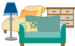
Nhận hàng công kênh

Thành phố đã thu thập những phản hồi có giá trị từ hàng nghìn cư dân thông qua các sự kiện cộng đồng, khảo sát và cuộc họp hàng tháng với các lãnh đạo từ nhiều tổ chức cộng đồng khác nhau. Đáng chú ý, 80% khách hàng dân cư bày tỏ sự hài lòng hoặc hài lòng cao với dịch vụ thu gom rác, rác hữu cơ, rác tái chế hiện tại. Cư dân cũng cung cấp những hiểu biết sâu sắc, giàu ý nghĩa về các lĩnh vực tiềm năng cho hoạt động cải tiến dịch vụ, bao gồm: