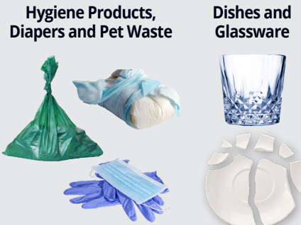
Hygiene Products, Diapers and Pet Waste

When in doubt, throw it out. Nếu nghi ngờ, hãy vứt chúng đi.