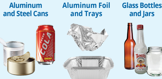
Aluminum and Steel Cans