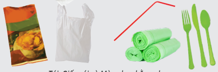
Túi, Giấy gói và Màng bọc bằng nhựa - Ống hút và đồ dùng, sản phẩm nhựa được dán nhãn "Có thể làm phân xanh" hoặc "Có thể phân hủy sinh học"

Plastic Straws and Utensils, Products Labeled "Compostable" or "Biodegradable"