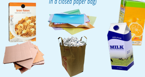
Hộp và bia Các tông (rỗng và làm phẳng) • Giấy hỗn hợp (giấy vụn phải ở trong túi giấy kín) Hộp giấy

Cardboard (empty and flatten) Mixed Paper (shredded paper must be in a closed paper bag) Paper Cartons