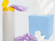
Đĩa giấy, Cốc và Hộp mang đi bằng Giấy Khăn giấy và Khăn lau vệ sinh dùng 1 lần