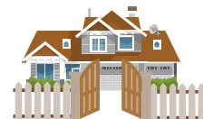
Các nhà ở trên phố riêng hoặc trong cộng đồng có cổng

Thành phố có kế hoạch gửi thư vào đầu năm 2025 tới các chủ sở hữu bất động sản dân cư, là những người có thể chịu ảnh hưởng của bất kỳ thay đổi nào. Bạn muốn tìm hiểu thêm? Hãy cập nhật thông tin bằng cách truy cập cleangreensd.org . Nếu có thêm câu hỏi hoặc nhận xét, vui lòng liên hệ với chúng tôi qua địa chỉ trash@sandiego.gov .