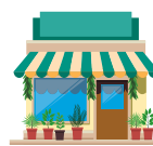
Mga ari-arian na hindi tirahan