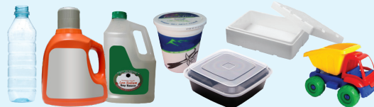
Mga Plastik na Botelya, Lalagyan, Talukap, Matigas na Plastik, Mga Laruang Plastik, at Packaging na Styrofoam

Plastic Bottles, Containers, Lids, Hard Plastics, Toys, and Styrofoam Packaging