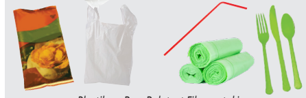
Plastik na Bag, Balot, at Film na takip Plastik na dayami at Kagamitan, mga produktong may label na "Compostable" o "Biodegradable"

Plastic Straws and Utensils, Products Labeled "Compostable" or "Biodegradable"