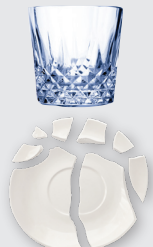
Mga Produktong Pangkalinisan, Diaper at Basura ng Alagang Hayop Mga pinggan at mga gamit sa salamin