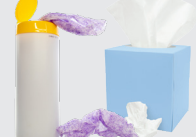
Mga Papel na Plato, Tasa, at Mga Kahong Pang-takeout Mga tissue at mga disposable na pamunas