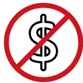
Palitan ng lagayan nang walang karagdagang bayad