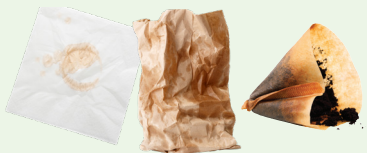
Mga Papel na Nabahiran ng Pagkain (mga papel na tuwalya, napkin, sako ng papel, Papel na gawa sa pergamin at filter ng kape)

Food-Soiled Paper (paper towels, napkins, paper bags, parchment paper and coffee filters)