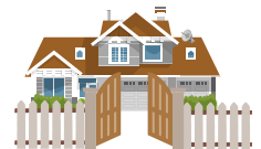
Mga tirahan sa pribadong kalsada o mga komunidad na may tarangkahan

Noong unang bahagi ng 2025, ang Lungsod ay nagbabalak magpadala ng mga sulat sa mga may-ari ng residential na ari-arian na maaaring maapektohan ng anumang pagbabago. Gusto mo bang malaman pa? Para manatiling updated, bisitahin ang cleangreensd.org . Para sa karagdagang katanungan o puna, mangyaring magpadala ng email sa trash@sandiego.gov .