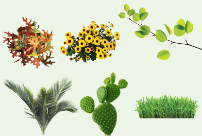
Mga Pinutol na Halaman at Basura mula sa Hardin