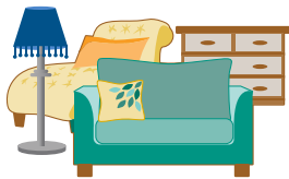
Pagkuha ng malalaking item

Libu-libong tao ang nagbigay ng mahalagang feedback sa Lungsod sa pamamagitan ng mga kaganapan sa komunidad, mga talatanungan, at buwanang pagpupulong kasama ang mga lider ng iba't ibang organisasyong nakabase sa komunidad. Kapansin pansin, 80% ng mga residente ay nagsabi na sila ay kontento o labis na kontento sa mga serbisyo ng pagkuha ng basura, organikong basura, at pag-recycle na kanilang natatanggap. Bukod pa rito, nagbigay ang mga residente ng mga makabuluhang suhestiyon hinggil sa mga posibleng lugar kung saan maaaring mapabuti ang mga serbisyo: