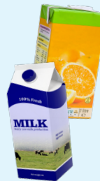
Karton (walang laman at pinatag) • Halo-halong Papel (ang punit- punit na papel ay dapat nasa nakasarang papel na bag) Mga karton ng papel

Plastic Bottles, Containers, Lids, Hard Plastics, Toys, and Styrofoam Packaging