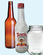
mga lata ng aluminyo at bakal Aluminyo at foil at mga tray • mga bote ng salamin at garapon