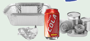
Lon nhôm và kim loại được làm sạch