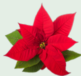
Cây trồng (Không có chậu - vui lòng tái sử dụng hoặc tái chế)