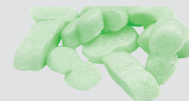
Hạt xốp đóng gói