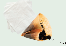
Giấy lọc cà phê và khăn giấy dính thức ăn