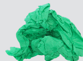
Giấy trang trí quà (tái sử dụng khi có thể)