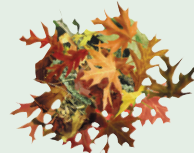
Lá khô và phần cắt tỉa từ sân vườn