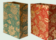
Túi đựng quà (tái sử dụng khi có thể)