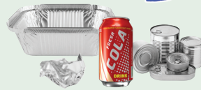
Malinis na aluminum at mga latang metal