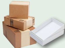
Karton at mga kahong papel ng regalo (gamitin muli kung maaari)