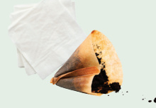
Mga salaan ng kape at narumihang mga napkin