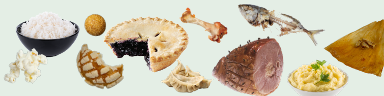
Natirang mga pagkain