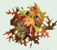
Tuyong mga dahon at mga pinutol sa bakuran