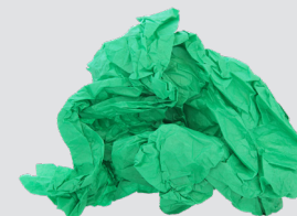
Pambalot na papel na tisyung (gamitin muli kung maaari)