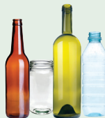
Lahat ng mga banga, salamin at mga boteng plastik