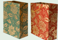
Mga bag ng regalo (gamitin muli kung maaari)