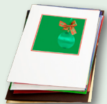
Greeting card na papel (walang mga kard na larawan)