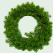
Natural na koronang bulaklak at kuwintas na bulaklak (Walang mga palamuti, mga bow o mga ilaw)