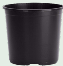
Plastik na masetera ng tanim