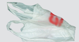
Mga bag na plastik*