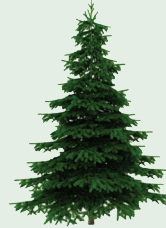
Christmas tree (putulin ang kahoy upang magkasiya sa basurahan)